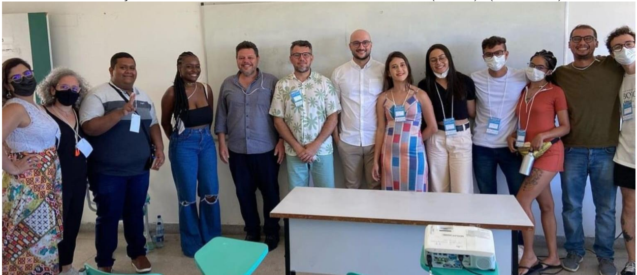
Imagem 9 – Registro de um dos GDs (GD-1) do Congresso Nacional da Associação Brasileira de Ensino de Ciências Sociais (Abecs). (nov. 2022).