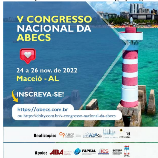
Imagem 4 – Exemplo de Card de divulgação geral do evento.