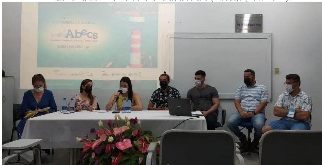
Imagem 7 – Mesa de solenidade do V Congresso Nacional da Associação Brasileira de Ensino de Ciências Sociais (Abecs). (nov. 2022).

A segunda atividade ocorreu no Auditório do Centro de Educação (Cedu), reunindo representantes da Universidade, do Cedu, do Instituto de Ciências Sociais, do PPGS, da Fapeal, da comissão organizadora e da Abecs. Antes de dar início às atividades, foi instalada uma mesa solene, destacada na Imagem 7.